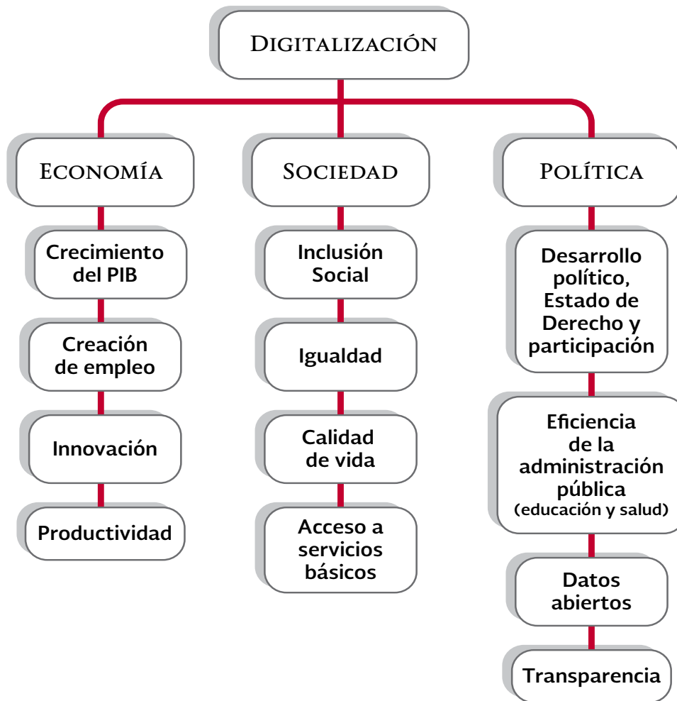
Figura 1. Impactos Multidimensional de la Digitalización