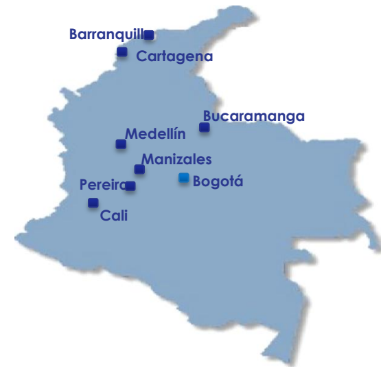
Centros de operación